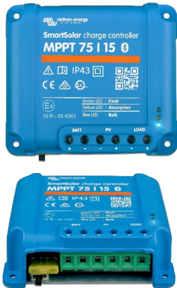
SmartSolar Lade-Regler MPPT 75/15