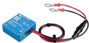
Bluetooth-Erkennung Smart Battery Sense