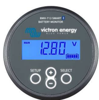
Bluetooth-Erkennung BMV-712 Smart Battery Monitor